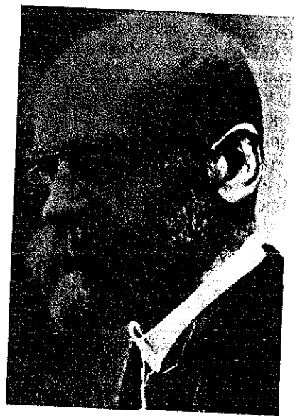
David Émile Durkheim (1858-1917).

É justamente a educação um dos exemplos preferidos por Durkheim para mostrar o que é um fato social. O indivíduo, segundo ele, não nasce sabendo previamente as normas de conduta necessárias para a vida em